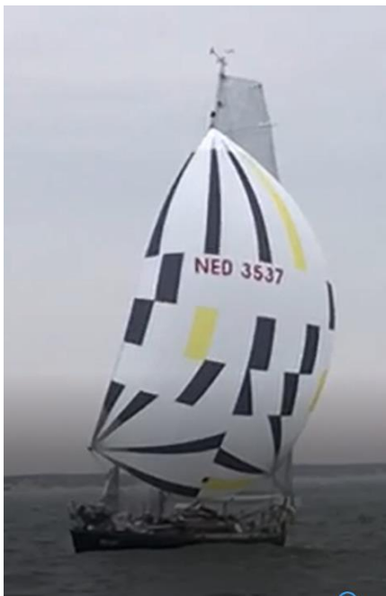
Foto: "Black Magic Woman" van een filmpje gemaakt door Wolfgang Okken vanaf de "Bon Bida" Westelijk van Texel.