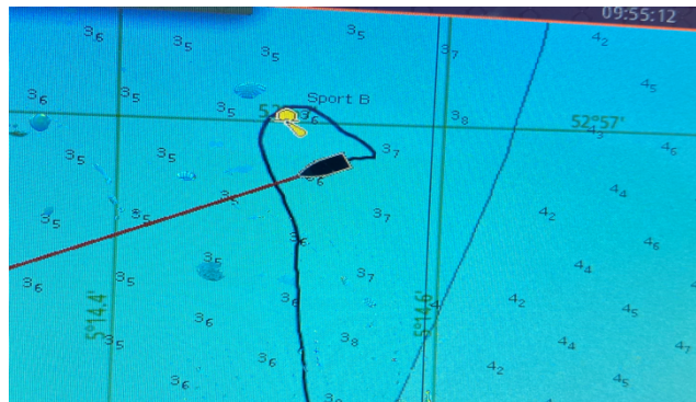
"Ererondje aan meneer Sport B boei"

05:30 hr, best vroeg. Ik maak mijn journaal op orde en besluit rustig aan te doen. Om 08:00 hr verlaat ik voor de wind de Kreupel in de miezerregen met een kleine mijl zicht. ETA Sport B 10:00 hr. Ik heb nog even een extra rondje om de boei gemaakt,